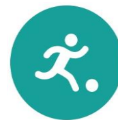
Spel en beweging / bewegingsonderwijs